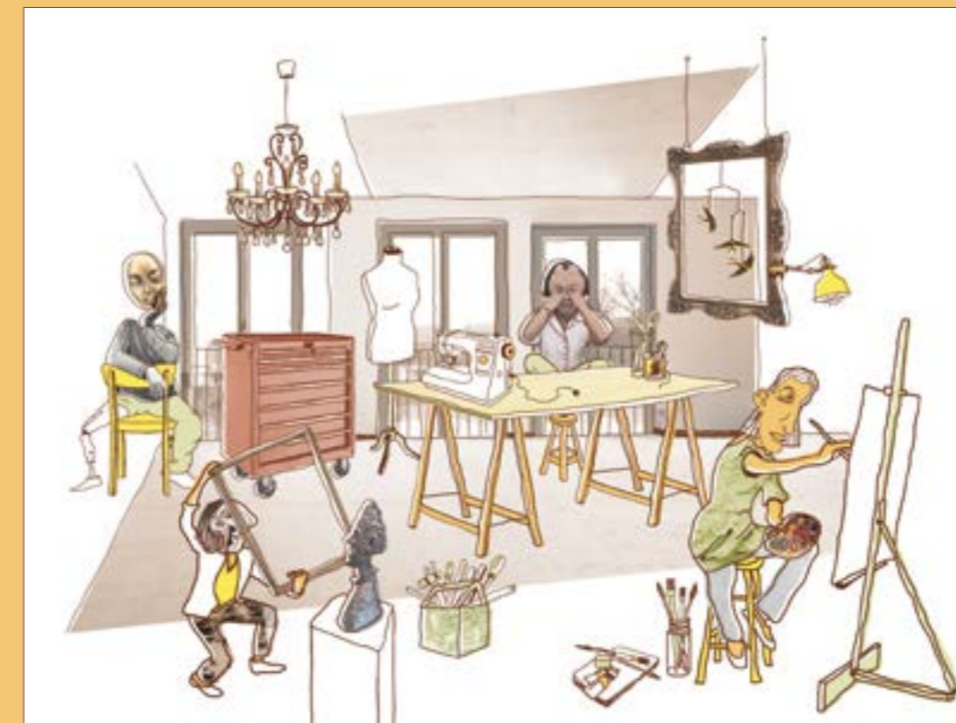
Illustration Atelier im 2.OG