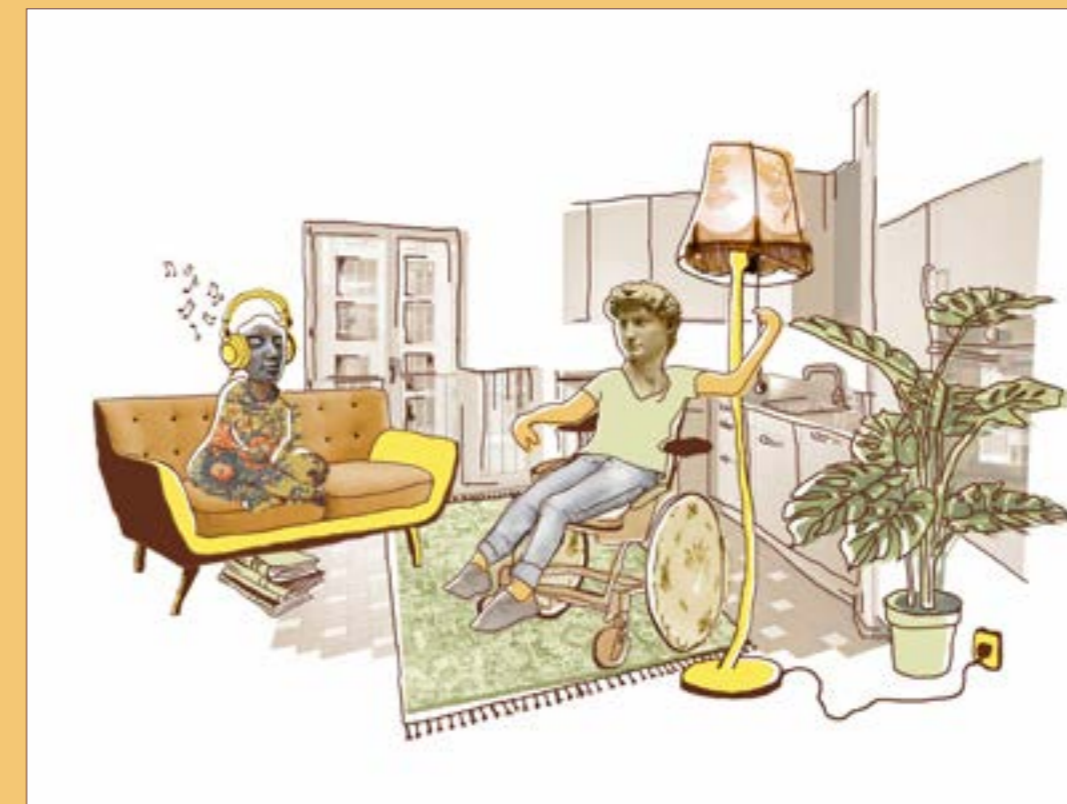
Illustration Wohnen in den Clusterwohnungen

«Kulturelle Vielfalt braucht zur Entfaltung besondere Orte. Flexible und geschützte Räume dienen dabei als Inkubator und Showcase für eine Vielfalt an künstlerischen Angeboten unterschiedlicher Menschen. Räume der Kulturproduktion fördern die Entwicklung einer örtlichen Identität, fungieren als gesellschaftliche Schnittstellen und lösen soziale Grenzen durch Vernetzung und Begegnung auf.»